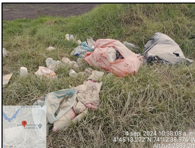
Ilustración 2. Inadecuada disposición y acumulación de residuos de construcción y demolición, punto 5.

Dentro del recorrido de control y vigilancia, en el punto 5 con coordenadas 4°45'13.272"N – 74°12'38.976"W se evidenció la inadecuada disposición de residuos de construcción y demolición – RCD. (ver ilustración 2).