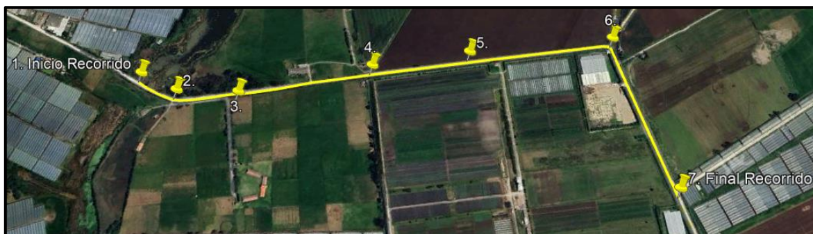
Ilustración 1. Recorrido de control y vigilancia en la vereda El Cacique.

Con base en lo anterior, el día 04 de septiembre de 2024 se realizó recorrido de control y vigilancia en la vereda El Cacique desde las coordenadas 4°45'8.19"N – 74°13'9.138"O hasta las coordenadas 4°45'2.178"N – 74°12'19.584"O (ver ilustración 1. Ruta amarilla)