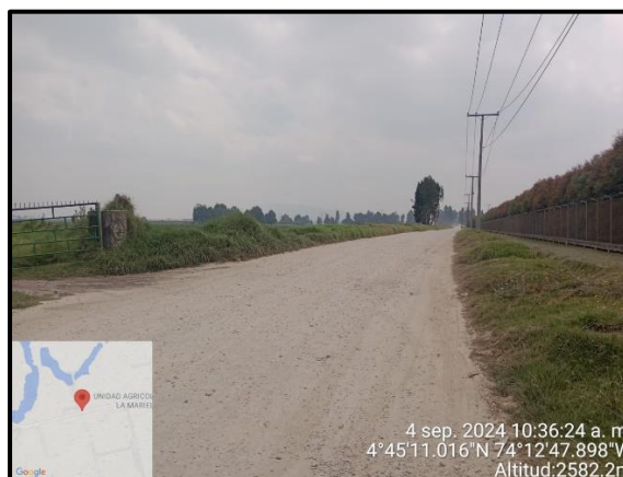
Ilustración 6. Evidencia recorrido, punto 4.