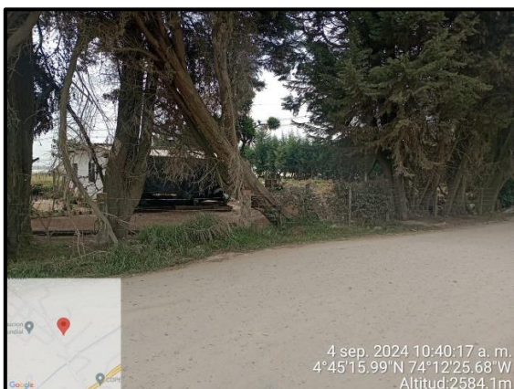
Ilustración 7. Evidencia recorrido, punto 6.

C.P. 250020 Tel. +57(1) 823 40 70 823 40 71 / 823 40 73 Fax. +57(1) 825 76 20 Dir. Cra. 14 No. 13-05