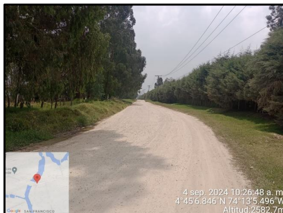
Ilustración 4. Evidencia recorrido, punto 2.