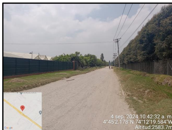
Ilustración 8. Evidencia recorrido, punto 7.