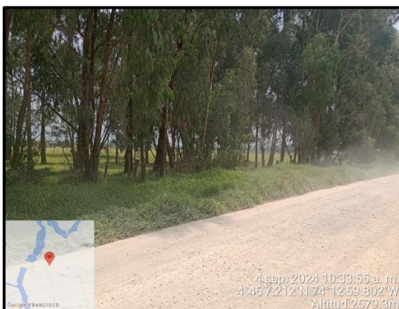
Ilustración 5. Evidencia recorrido, punto 3.